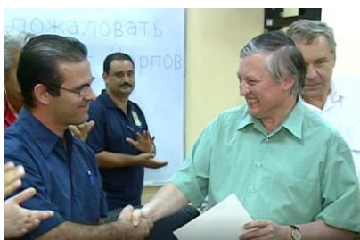
Figura 1. El GM Anatoly Karpov es reconocido como Miembro de Honor de la Cátedra de Ajedrez UCI.

Muestra de lo anterior es que la Cátedra de Ajedrez sirvió de sede a las bases de entrenamiento de los equipos cubanos de ambos sexos a las Olimpiadas Mundiales de Ajedrez desde el 2004 al 2012. Acogió la simultánea de más de 4000 tableros, con la presencia del Gran Maestro Anatoly Karpov y 250 simultaneístas, el lunes 11 de abril del 2008. A partir de ese momento se le denominó La Universidad del Ajedrez en Cuba.